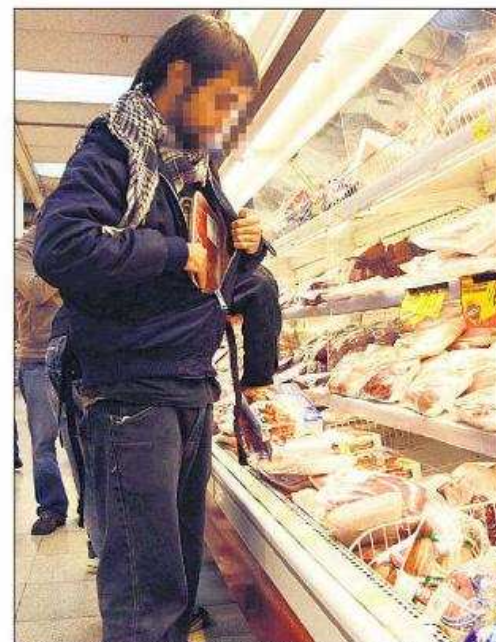
PERFIL DE LOS "MECHEROS".— El 31% de los autores de los hurtos tiene una edad que fluctúa entre los 30 y los 60 años, según las cifras de Alto S.A.

El hurto "hormiga" está penado según el valor de la especie robada y el grado de desarrollo del delito. Si el ladrón es sorprendido con un artículo que tiene un precio menor a media unidad tributaria mensual (UTM), éste arriesga una multa de 1 UTM ($36.792) a 4 UTM. De ser reincidente, se duplica la sanción monetaria. Mientras que el hurto de un artículo que cuesta entre 1 y 4 UTM tiene una pena de 61 días a 540 días. Y si la especie robada tiene un valor entre 4 y 40 UTM, la pena es de 541 días a 3 años de cárcel.