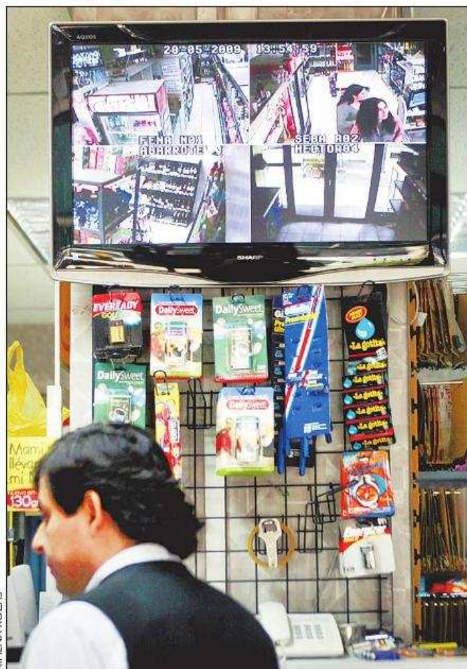
Medidas como las cámaras de vigilancia disuaden a los delincuentes.